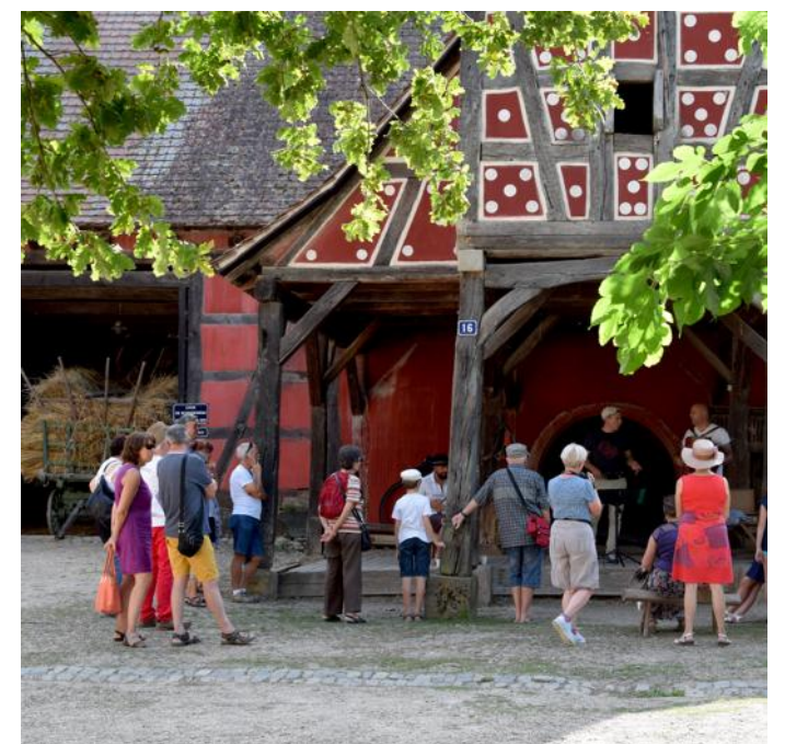
Dimanche, l'Écomusée d'Alsace proposera des animations, des dégustations et la vente de produits frais.