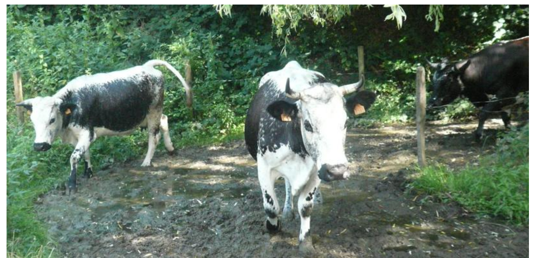
Les vaches de race vosgiennes seront à l'honneur ce dimanche à l'Écomusée d'Alsace.

Deux médiations quotidiennes du musée seront particulièrement à suivre dans ce cadre : « Du pis au pot » et « Douceurs lactées » à 16 h et à 16 h 30. Chargé de mission « agriculture et ressources locales » au Parc naturel régional des Ballons des Vosges, Julien Bourbier assurera une médiation autour de la diversité de systèmes : les produits, les paysages, les troupeaux, les savoir-faire... En cuisine, des recettes salées et sucrées seront respectivement réalisées le